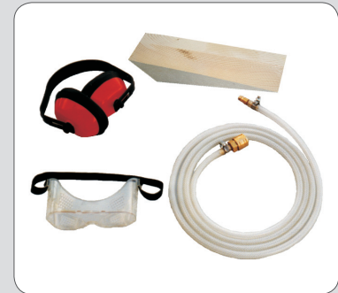
Lieferumfang des Boosters